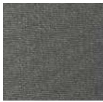
3439 FORCE BASALTO