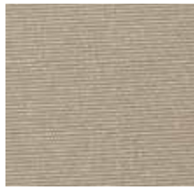
3433 FORCE CARAMEL