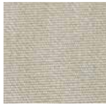
3434 FORCE TENNERE