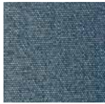
3437 FORCE MARINO