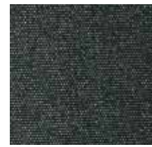
3441 FORCE NEGRO