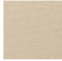
3432 FORCE BEIGE