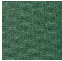
3436 FORCE BOTELLA