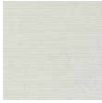
3431 FORCE MARFIL